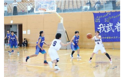
【バスケットボール女子の交流試合】

7月25日(土)には、サッカー部が池田中学校において、大野中学校と交流試合を行いました。雨の中、水が浮いたグラウンドの状況で、フィールドに立つ11人は、気迫あふれるプレーを最後まで見せてくれました。3年生での最後の試合・・・3月から臨時休業となり練習試合を行うことも許されない中、久しぶりに行う試合が3年生全員で行う最後の試合となりました。与えられた状況の中で、精一杯のプレーをする姿に心が打たれました。試合は、押し気味にゲームを進めた池中が先制するも追いつかれ終盤に。終了直前に、勝ち越しのゴールを上げ、勝利しました。雨の中でしたが、終了後には、清々しく爽やかな笑顔が広がり、輝く生徒の姿が印象的でした。