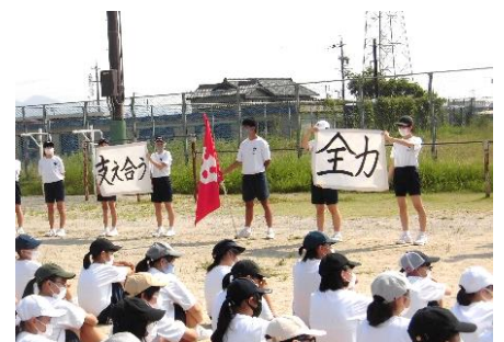
【キーワードを示す赤団団役員】

グラウンドに出るときから、団役員から速やかに移動を促す働きかけがあり、各団の前では大きな声で堂々と話す姿がありました。団員は、その姿に応え大きな返事を返していました。仲間と思いを共有し、スローガンや目当てに向かって、みんなと一緒に高まっていく姿が見られることを期待しています。