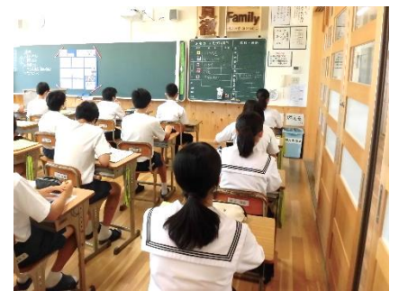
【話を真剣に聞く3年生の姿】

夏休みが明け、8月17日より学校が再開されました。1時間目の学活の中で、学校長からは、「自分への自信と誇り」を持つことについて、最後まで自分の力を発揮し、自分と仲間と胸を張れる、そんな1日を継続して送ってほしいと話がありました。各学級において、生徒は一人一人が真剣に話を受け止め、今後の自分の生活に生かしていこうとする気持ちを感じられました。厳しい暑さが続く中で、自分自身を高めようと積極的に行動していく姿を大切にしながら、仲間と関わり合い、体育祭に向けてどのように取り組んでいくか、前期で高まった姿を後期にどうつなげるか、見通しをもち生活して欲しいと考えています。