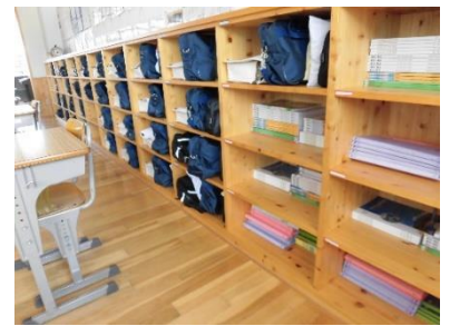
【整頓された1年生ロッカー】

8月19日(水)～25日(火)の1週間は、環境部強化週間として、「常に美しい教室をつくり 花を咲かせよう」の取組が行われました。この取組は、移動教室によって使用していない空き教室の「美しい教室」を目指し取り組まれるもので、常に環境に気を配り、誰もが気持ちのよい過ごしやすい環境を自分たちの手でつくっていくことをねらいとして行われました。具体的には、机列が整っていることや南側の窓が閉まっていること、床にごみが落ちていないことなど、環境部や環境部班を中心に学級全体で行いました。活動の中から、よい姿を花びらに記入し、広げていきました。仲間のよさを認め合いながら、組織的な動きを学級内でつくり、環境面に対する意識を高めていく姿が素晴らしかったです。