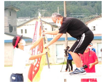
【総合優勝した赤団】

今年は、応援合戦を行わず、例年行っていた学級対抗リレーもなしとし、競技を短縮し午前中での開催となりました。応援では学級ごとに設置されたテントの中で、マスクを着けて仲間の頑張りを拍手で称える姿が見られました。