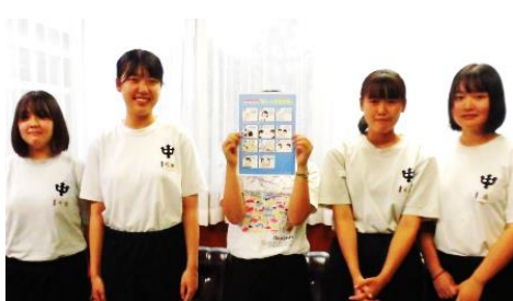
【ポスター作成を報告した美術部】

美術部の2、3年生を中心に、「新しい生活様式」を取り入れて生活することの大切さを訴えようと、全校に向けた啓発ポスターを作成しました。全部で11の内容について、イラストで分かりやすく示しています。日常生活の中で、一人一人が意識を高くして、自ら感染拡大を防止できるよう取り組んでいきます。