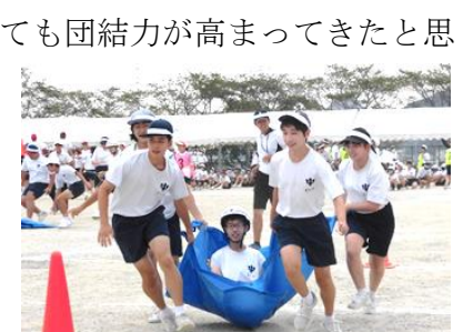
【「アラジン」で力を合わせる白団】