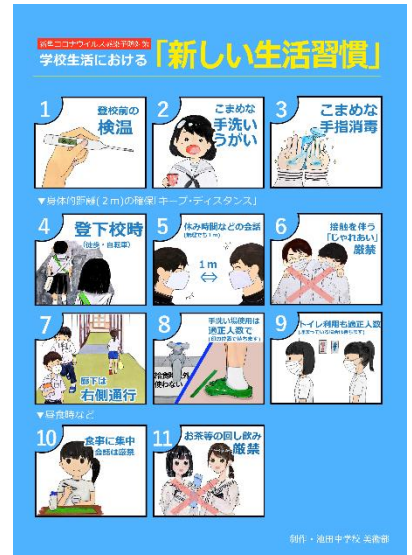
【美術部が作成したポスター】