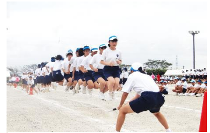
【大縄跳びをする青団】

3年生は、他のクラスなどに行き、1、2年生と関わって行きました。その結果、事前取組では、赤団でオールパーフェクトをとることができました。オールパーフェクトになるまでに、多くの困難がありました。上手いいかないときもありました。それでも支えてくれた学級の仲間や団役員、赤団の仲間と、今日は、最高の体育祭をつくりたい。白団、青団の最高のライバルと共に僕たちでしかつぐれない体育祭をつくっていきます。